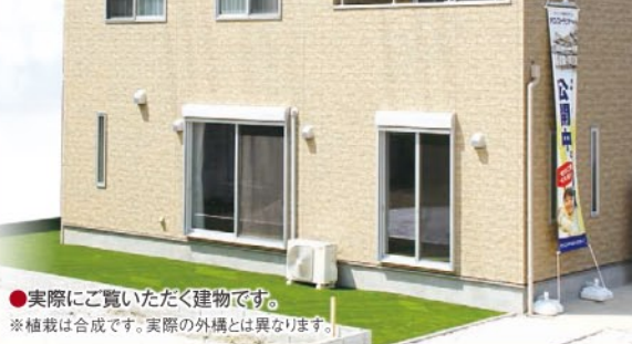
●実際にご覧いただく建物です。 ※植栽は合成です。実際の外構とは異なります。